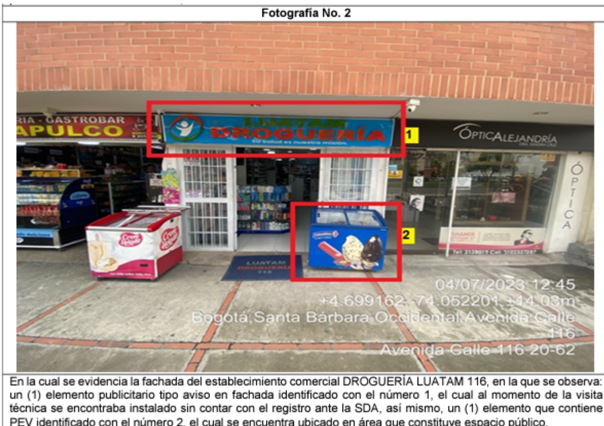
En la cual se evidencia la fachada del establecimiento comercial DROGUERÍA LUATAM 116, en la que se observa: un (1) elemento publicitario tipo aviso en fachada identificado con el número 1, el cual al momento de la visita técnica se encontraba instalado sin contar con el registro ante la SDA, así mismo, un (1) elemento que contiene PEV identificado con el número 2, el cual se encuentra ubicado en área que constituye espacio público.